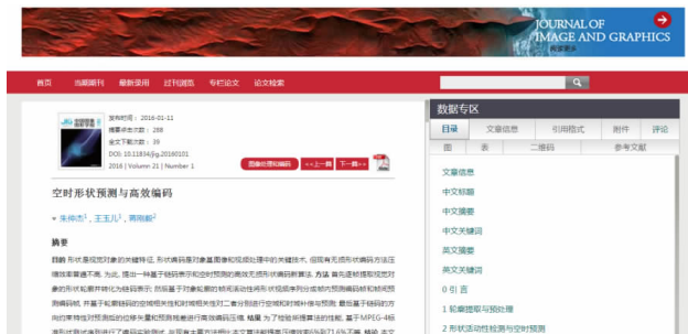
图 1 《中国图象图形学报》HTML 全文阅读模式

此外,读者通过关注微信公众号(遥感图像图形),不仅可以定期接收本刊推送的最新论文、编辑原创、科技爆文等不同类型的信息,而且可以随时随地自助查询年度图像图形领域会议动态、浏览预出版论文、阅读感兴趣的专业论文等。