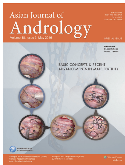
图4 《亚洲男性学杂志》2016年第3期“男性不育核心概念与最新进展”封面

2016年第1期刊登了一幅显微输精管附睾吻合术手术示意图。输精管附睾吻合术是显微手术中极具挑战性的手术,对其缝合方法的创新与实践,具有很高的临床价值及借鉴意义,也是医学期刊学科价值的突出体现。该期封面将该手术示意图作为封面主题,背景简单,内容明了,且采用了将前景图虚拟作为背景的手法,使得原本单调、枯燥的手术图在保留临床医学特点的同时,更显得灵活、丰富。2016年第3期另一组精索静脉曲张修复术的多个术中图构成了封面。各个阶段的标志性图片分别呈现,手术完成后引入封面主题词:男性不育(图4)。通常,医学期刊刊登的手术图片较缺乏美感和艺术感,但通过对手术图片重点内容的突出、全新组合和交织,使得往常看上去“血淋淋”的手术图片化身为平和却又不失科学之美的封面图片。