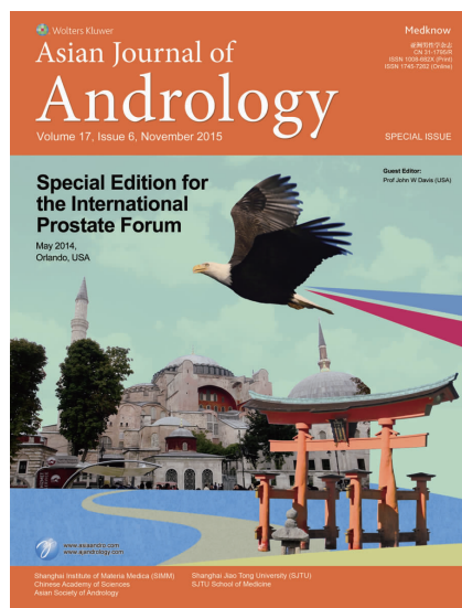
图5 《亚洲男性学杂志》2015年第6期“国际前列腺论坛”封面

2015年第6期刊发了“国际前列腺论坛”专刊。国际前列腺论坛是最初由美国、日本和土耳其的3家泌尿学机构发起成立的学术大会并轮流举办。本期专刊内容涵盖前列腺研究的各个方面,难以用封面来涵盖本期主题内容。考虑到该大会3地轮流举办的特点,封面将这3个国家的标志完美地糅合,且置于飞翔的天空和前进的道路之中,让读者感受到昂扬之情(图5)。