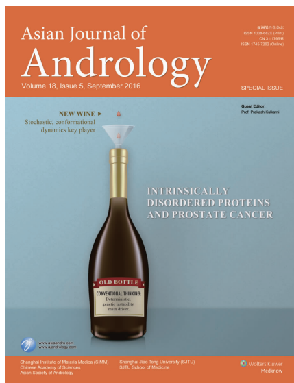
图6 2016年第5期“自身异常蛋白与前列腺癌”封面

2016年第5期的封面采用了简洁的图片:旧瓶装新酒——“自身异常蛋白与前列腺癌”,主要对前列腺癌相关蛋白的作用机制进行了进一步阐明及梳理(图6)。这一期封面策划,未按照惯常的设计思路出发,而是选取了一个独特的设计视角,实现了“简即繁”的设计意图。