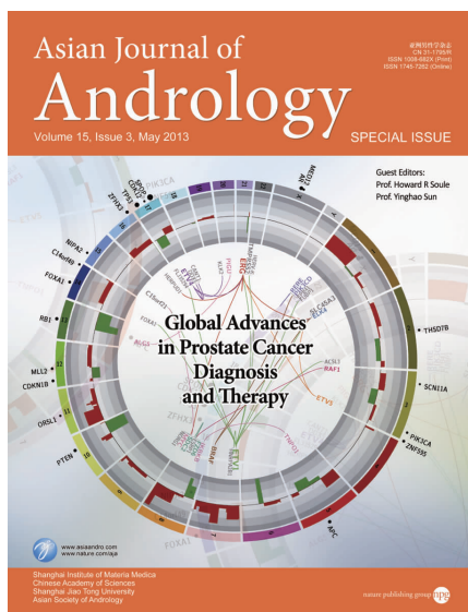
图1 《亚洲男性学杂志》2013年第3期“全球前列腺癌诊疗进展”封面

2013年第3期刊登了《应用下一代测序技术证实前列腺癌中分子改变的多样性》综述文章,从“组学”角度综合阐述了当前前列腺癌的诊疗现状,推动前列腺癌诊疗进入个体化精准治疗的新时代。这幅图来自前列腺癌基因组的综合分析,内容紧扣文章主题,色彩丰富、平滑的弧线与圆形的散点结合,给读者以大气磅礴的新时代朝气,使得封面吸引读者的能力得到提升(图1)。