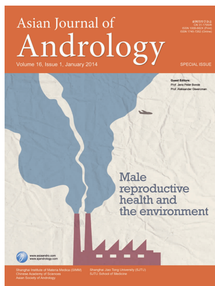
图2 《亚洲男性学杂志》2014年第1期“男性生育健康与环境”封面

2014年第1期的《亚洲男性学杂志》的封面图片采用了版画风格的艺术形式,用美学相互衬托的艺术形式巧妙地表达了“男性生殖健康与环境”的主题。男性的脸和精子直观地表示了“男性生殖健康”,厂房、烟囱形象地勾勒出男性所处的工作环境,飞机作为现代生活环境的代表成为男子脸部的眼睛(图2)。整幅封面构图别出心裁,多种视觉符号的巧妙构图,呈现出有别于语言文字的视觉美感,用经典元素推陈出新地勾画出男性生殖健康研究中的点滴。