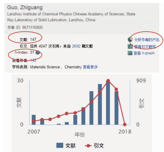
图 4 科研表现分析

除借助网络工具,一些传统方法也很有效。如组织编辑积极参加领域内的国际学术会议,听取会议报告,积极与参会人员进行交流,在参会专家中邀请合适的科研人员成为编委。还可以通过跟踪竞争期刊发表的热门文章来发掘符合条件的科研人员。