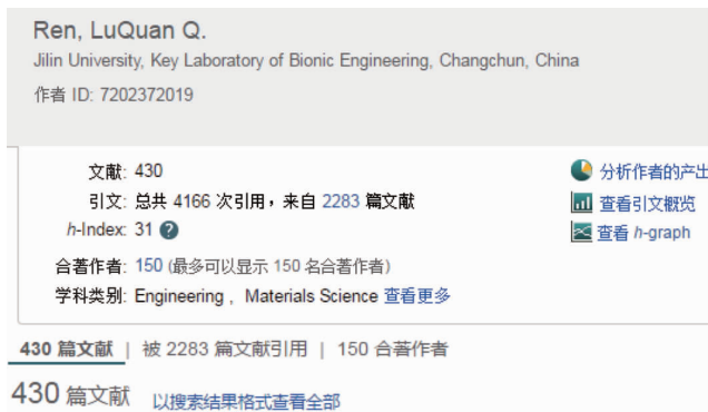
图1 Scopus 得出的编委学术成果引文统计信息