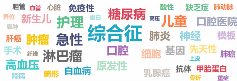
图2 用户搜索词的词云