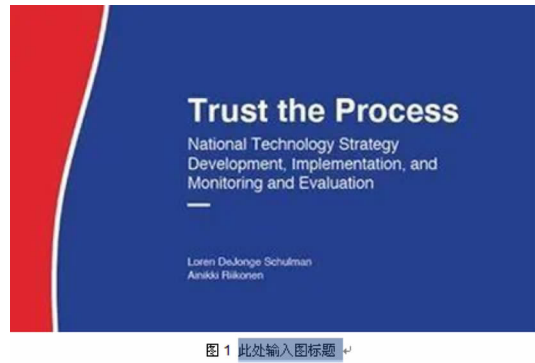
图 1 此处输入图标题

Sub 插入图标题() Dim ocl As CaptionLabel For Each ocl In CaptionLabels删除当前标签 If ocl.Name = "图" Then ocl.Delete End If Next Set ocl = CaptionLabels.Add(Name:="图")新建标签 With ocl .NumberStyle = wdCaptionNumberStyleArabic .IncludeChapterNumber = False .ChapterStyleLevel = 1 .Separator = wdSeparatorPeriod End With Selection.TypeText "图" Selection.InsertCaption Label:= "图", TitleAutoText:= "InsertCaption2", Title:= "", Position:= wdCaptionPositionBelow, ExcludeLabel:= 1 Selection.TypeText " " Selection.Fields.Add Range:= Selection.Range, Type:= wdFieldEmpty, Text:= "MACROBUTTON NOMACRO 此处输入图标题", PreserveFormatting:= False Selection.Style = ActiveDocument.Styles("K - 图标题") End Sub 由上述代码可知,首先通过 Selection 对象获取光标在文档的位置,其次设置 Selection 对象的字体样式、文本内容、分段操作等,最后实现工具栏上“插入图标题”按钮与宏的绑定。完成后,通过点击“插入图标题”按钮即可实现在图下方插入图标题的文字。实现效果见图 3。 下面给出“全角字母数字转半角”例子: Sub 全文全角字母和数字转半角() Dim myrange As Range 全文全角字母和数字转半角 Set myrange = ActiveDocument.Content myrange.Find.ClearFormatting